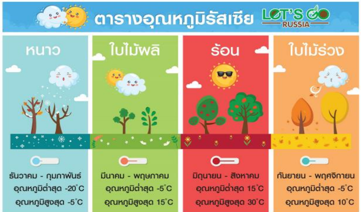
** อุณหภูมิเฉลี่ยโดยประมาณ **

นำท่านเดินทางเข้าสู่ เมืองมอสโก (Moscow) เป็นเมืองหลวงของประเทศรัสเซีย มีประวัติศาสตร์ยาวนานถึง 850 ปี เป็นศูนย์กลางทางเศรษฐกิจ การเงิน การศึกษา และ การเดินทางของประเทศ โดยตั้งอยู่ใกล้แม่น้ำมัสกวา ซึ่งในตัวเมืองมีประชากรอยู่อาศัยกว่า 1 ใน 10 ของประเทศ ทำให้เป็นเมืองที่มีประชากรหนาแน่นที่สุดในยุโรป และเมื่อสมัยครั้งที่สหภาพโซเวียตยังไม่ล่มสลาย เมืองมอสโกก็ยังคงเป็นเมืองหลวงของสหภาพโซเวียตอีกด้วย